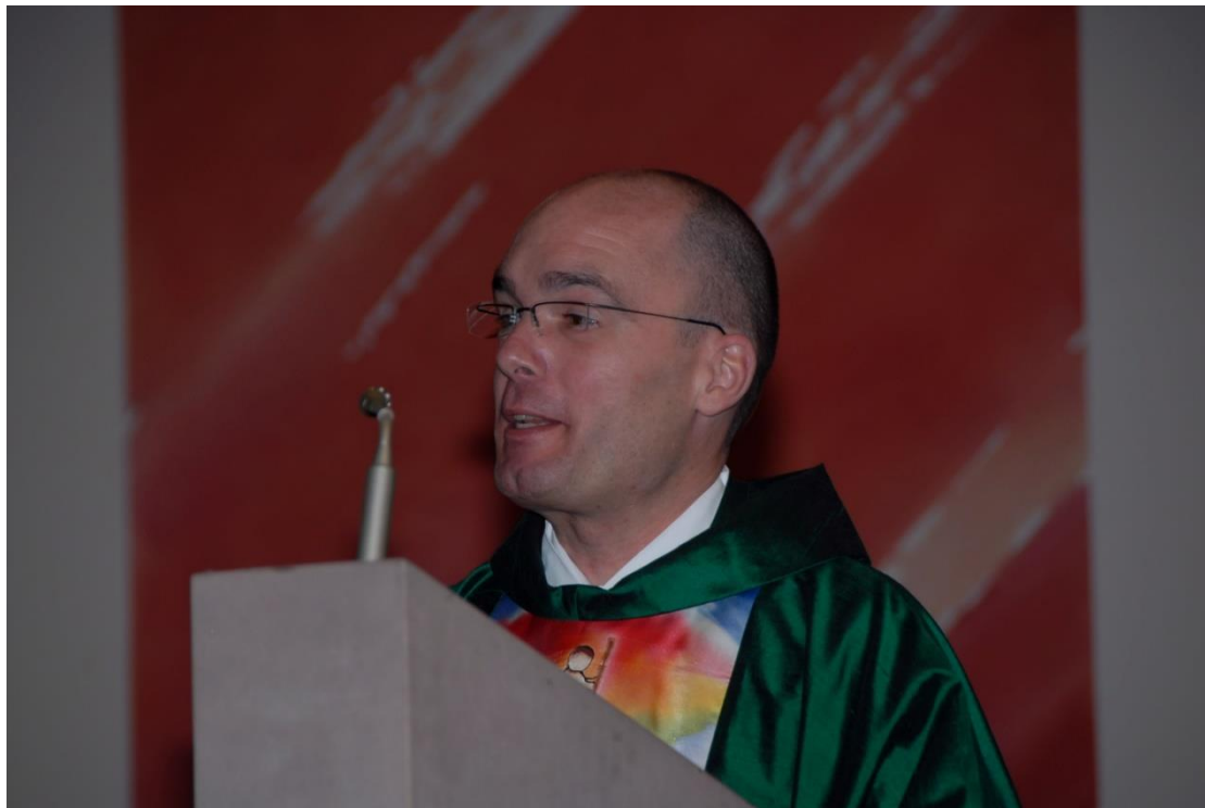
2007 Einführung zum Pastoralverbundsleiter in St. Hedwig