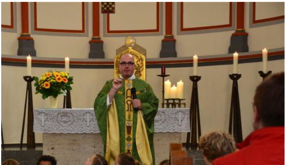
2012 Familienausflug nach Obernkirchen