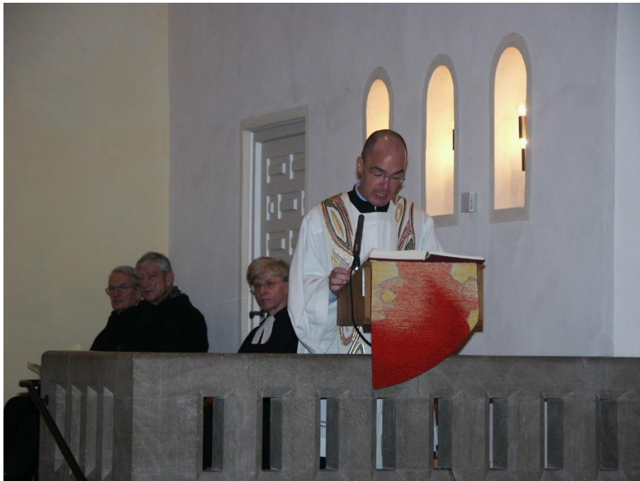
2004 40jähriges Jubiläum der ev. Apostelgemeinde