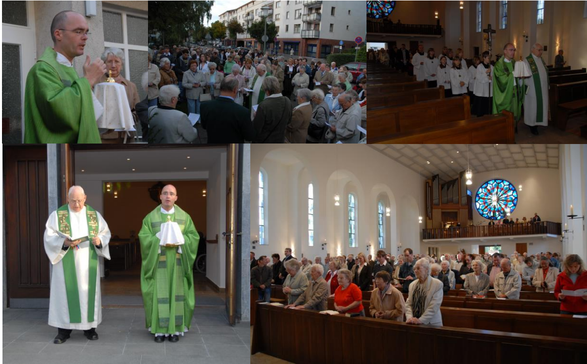
2007 Wiedereinzug in die renovierte Kirche