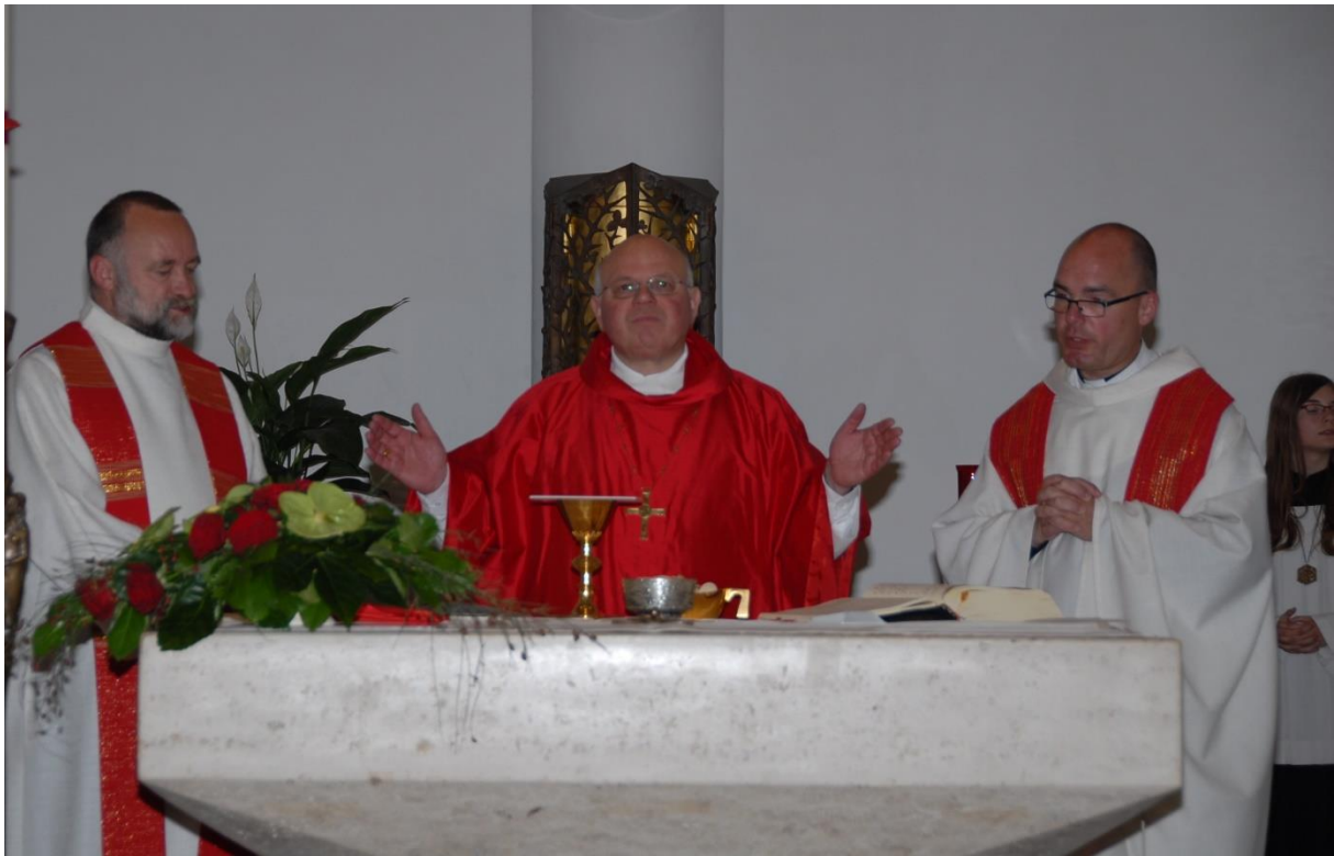
2011 Firmung mit Dechant Klaus Fussy und Weihbischof Hubert Berenbrinker