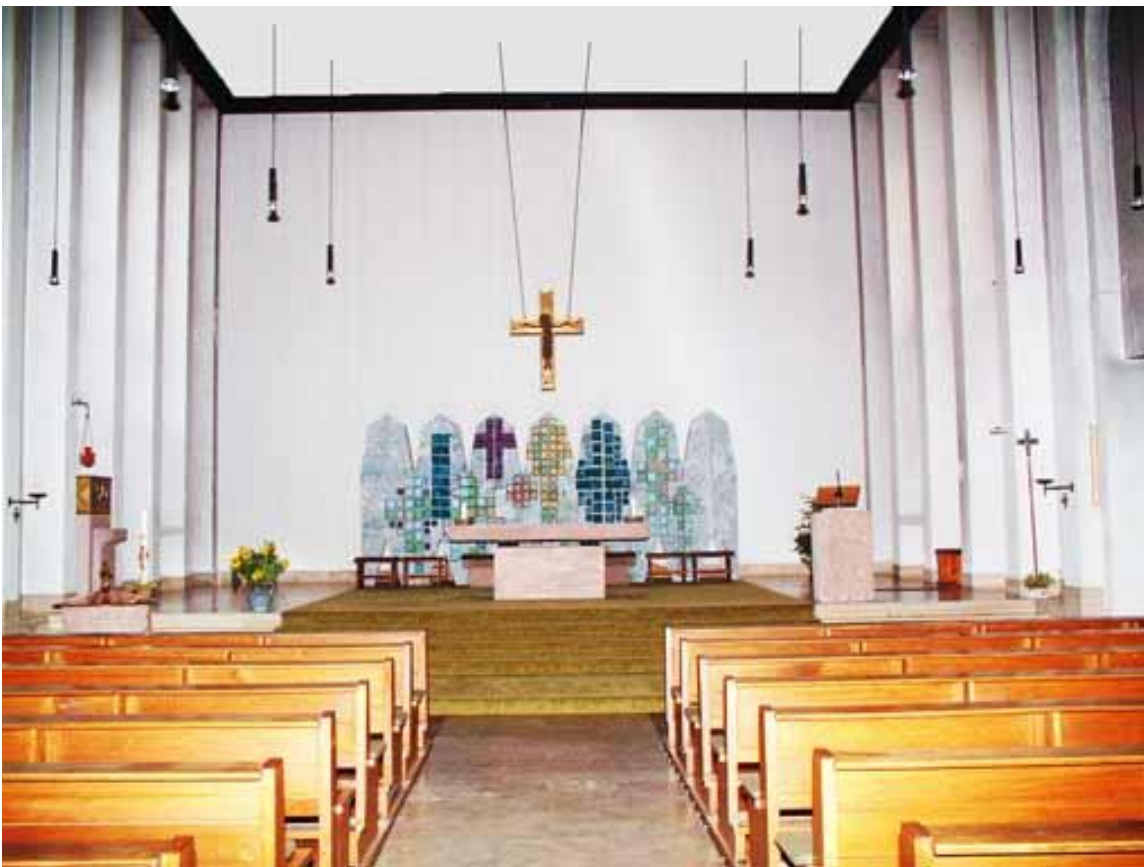
Abbildung 1: Nach der Renovierung 1975